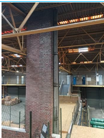
Matériaux : ZPSO-005 Prélèvement : Description : Conduit Localisation : Rez de chaussée - Hall 1 Résultat : Présence d'amiante