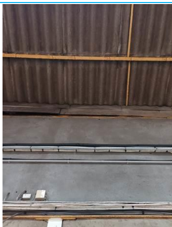
Matériaux : ZPSO-003 Prélèvement : Description : Plaques glasal sous toiture Localisation : Rez de chaussée - Hall 1; Rez de chaussée - Hall 2 Résultat : Présence d'amiante