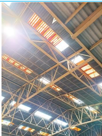
Matériaux : ZPSO-001 Prélèvement : Description : Plaques en fibres-ciment Localisation : Extérieur - Toiture Résultat : Présence d'amiante