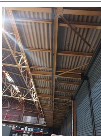
Matériaux : ZPSO-004 Prélèvement : Description : Plaques fibres-ciment sous coursive Localisation : Rez de chaussée - Hall 1; Rez de chaussée - Hall 2 Résultat : Présence d'amiante