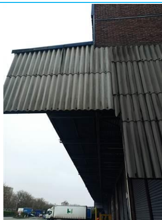
Matériaux : ZPSO-006 Prélèvement : Description : Bardage fibrociment Localisation : Extérieur - Auvents Résultat : Présence d'amiante